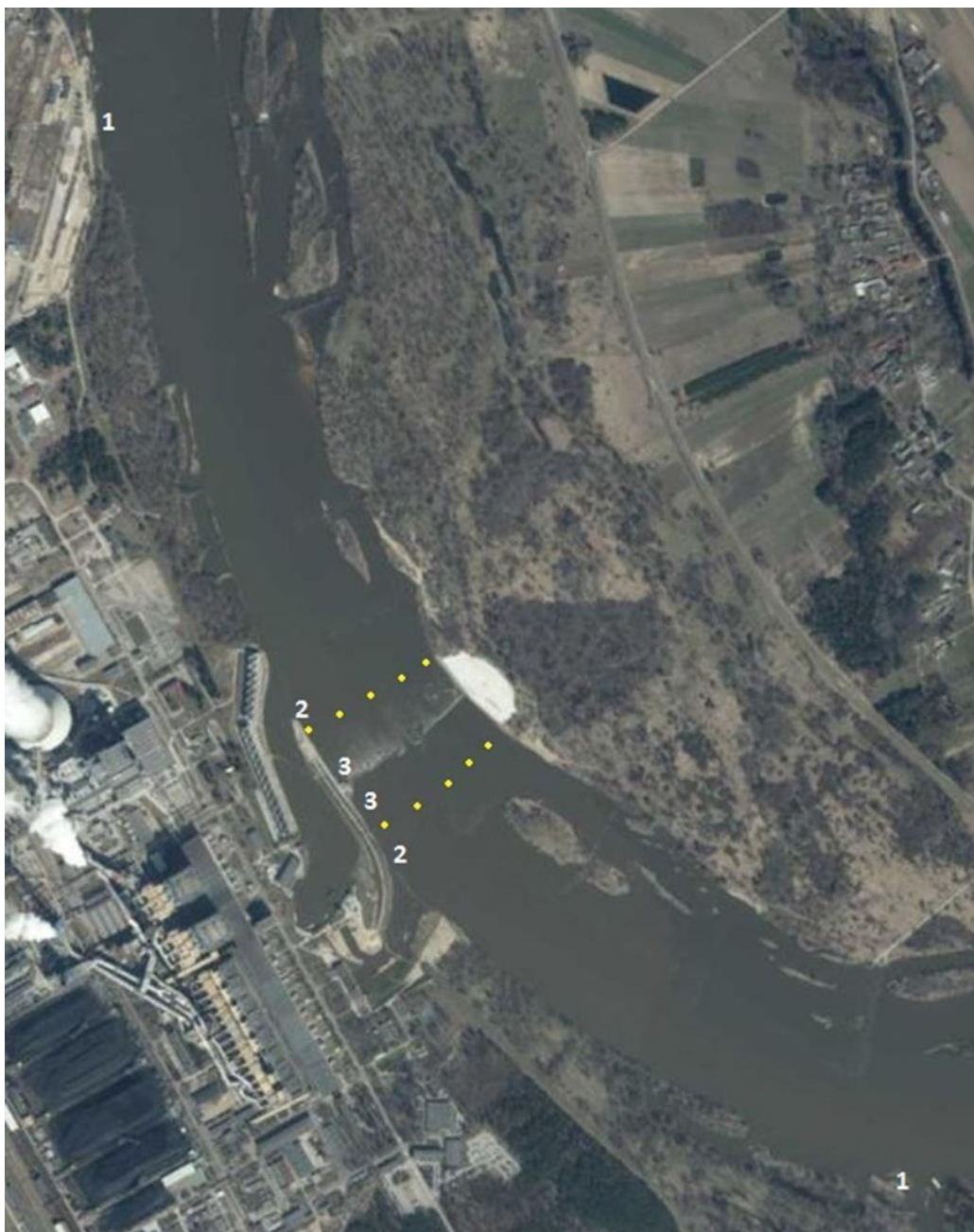
Fot. 2 Fotografia obrazująca sytuację nawigacyjną w okolicach progu w Świerżach Górnych