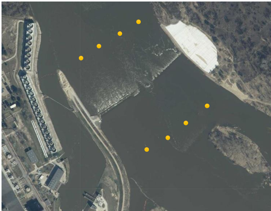
Fot. 1 Fotografia obrazująca położenie progu podpiętrzającego

Próg podpiętrzający Wisłę znajduje się na 425,95 km jej drogi żeglownej, w okolicy miejscowości Świerże Górne , ma charakter tymczasowy i służy zapewnieniu ciągłości zaopatrzenia Elektrowni Kozienice w wodę. Szlak wodny Wisły w tym miejscu jest zamknięty.