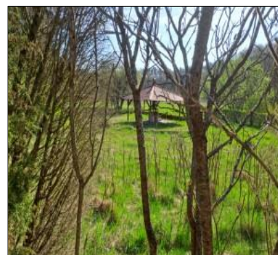
Widok na działkę nr 493